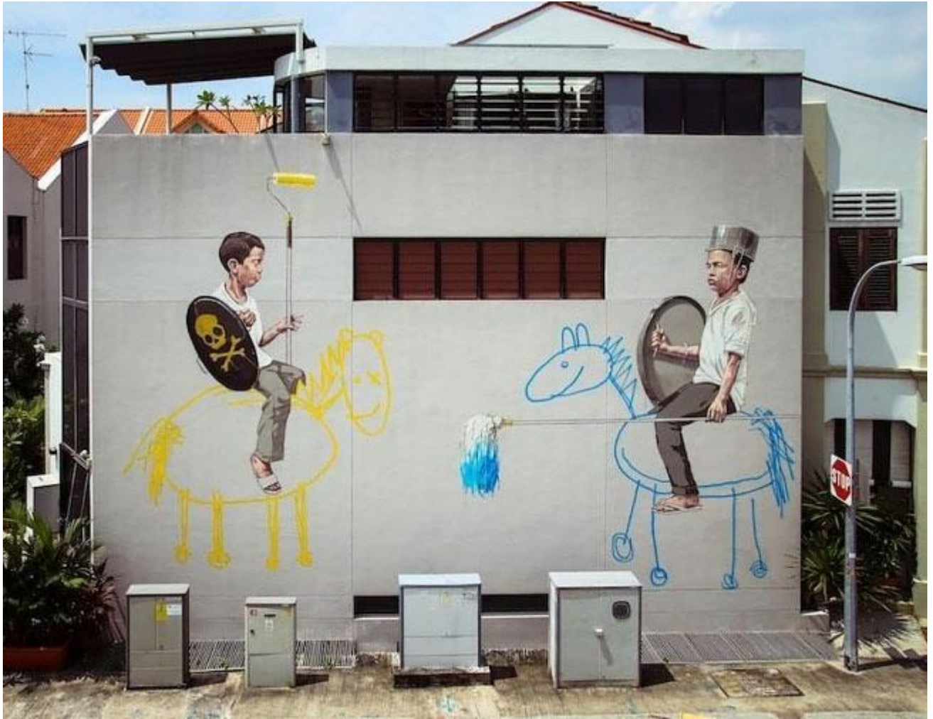
Ernest Zacharevic, Malaysia