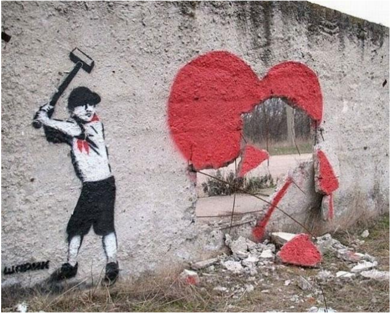
Sharik, Simferopol, Ukraine.