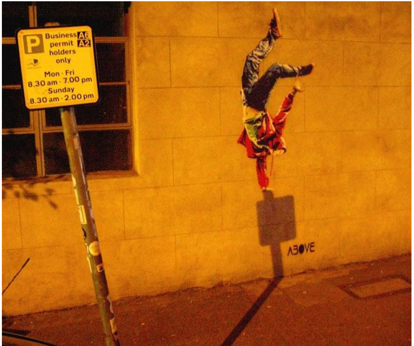
Above, London, England.