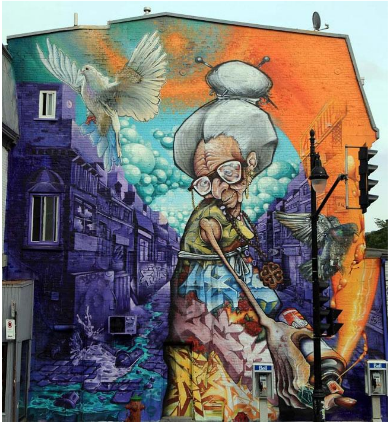
A'shop, Montreal, Canada.