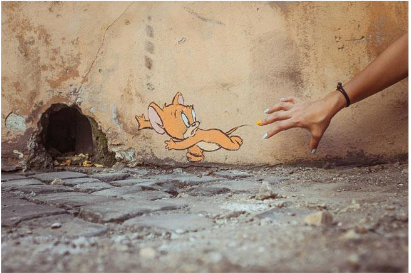
Ernest Zacharevich, Italy.