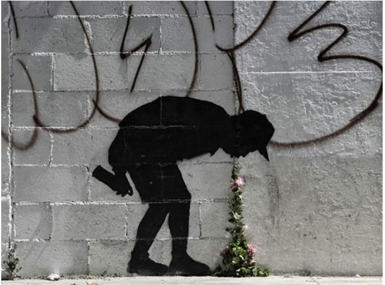
Banksy, Los Angeles, USA