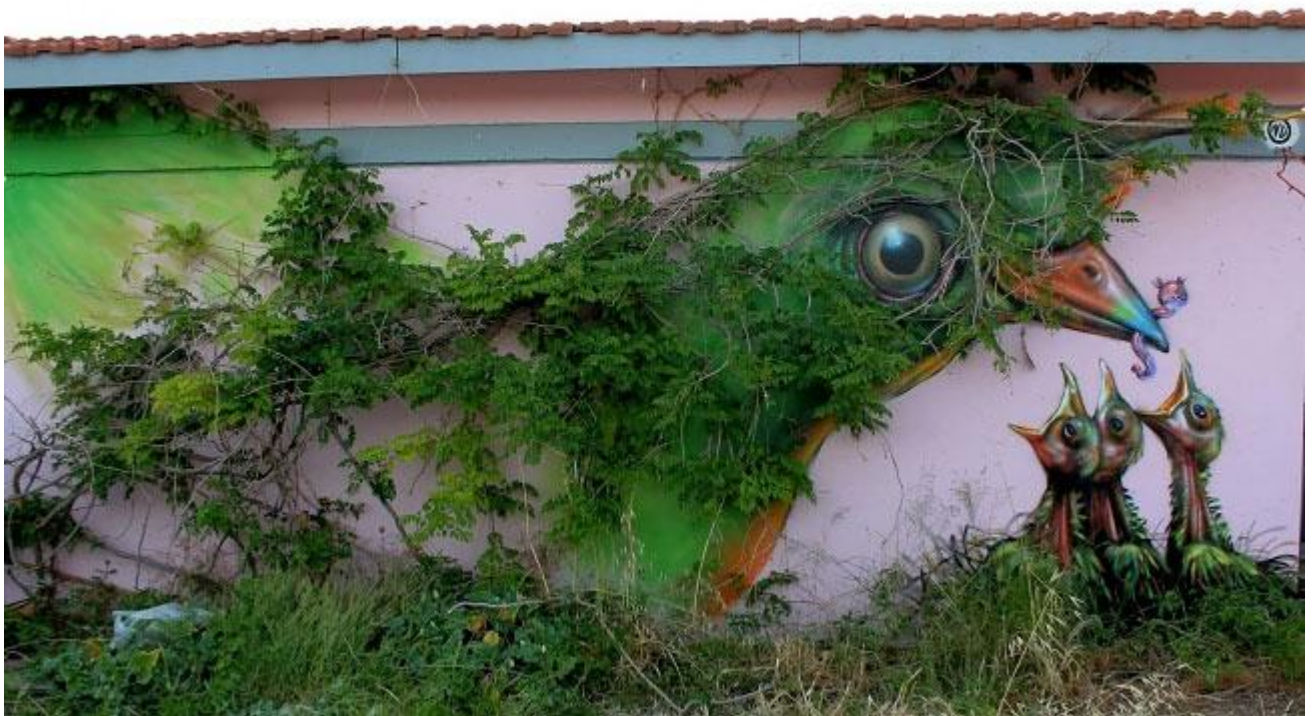
Wild Drawing, Athens, Greece.