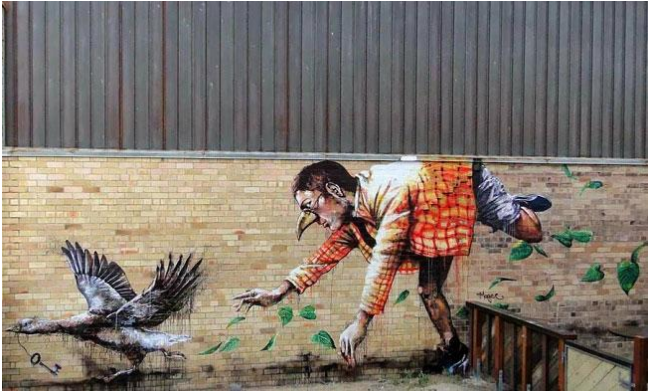
Fintan Magee, London, England.