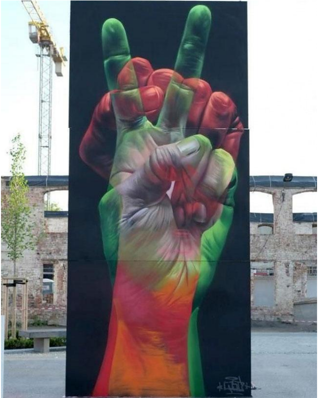
CASE, Wittenberg, Germany.