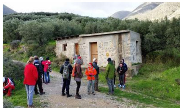
Στου Γερωνυμάκη το Χάνι

Από τη μέρα που σκοτώθηκε ο Μανώλης, οι βοσκοί έλεγαν ότι τα βράδια που περνούσαν από αυτό το σημείο, έβλεπαν ένα κεράκι να ανάβει και άρωμα και λιβάνι να βγαίνει από αυτό το σημείο. Σήμερα στο σημείο που είναι θαμμένος ο Μανώλης έχει τοποθετηθεί ένα μικρό εκκλησάκι προσφορά του Αλέκου Σακαδονικολάκη και του Νικόλαου Δρακάκη. Όποιος έχει δερματικά προβλήματα, όπως κουτσίκους, βάζει χύμα από το σημείο αυτό και εξαφανίζονται!