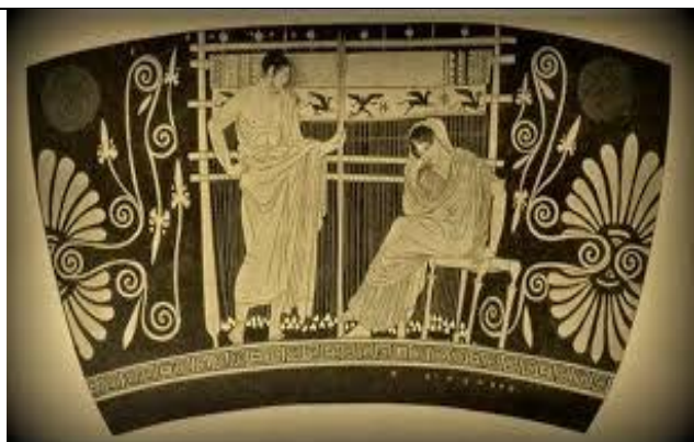
Ο περίφημος αργαλειός της Πηνελόπης

Ρώτησα ακόμα κι έμαθα για τον αργαλειό ότι ήταν το πιο πολύτιμο εργαλείο για κάθε νοικοκυρά. Κάθε αγροτική οικογένεια κάλυπτε τις ανάγκες της σε είδη ρουχισμού και σε κλινοσκεπάσματα με τον δικό της αργαλειό. Το στήσιμο του αργαλειού ήταν δύσκολο, γιατί έπρεπε να είναι σταθερός, για να μην κουνιέται με τα τραντάγματα, που έκανε η νοικοκυρά. Ο αργαλειός φτιαχνόταν από τέσσερα ίσα και βαριά όρθια ξύλα που συνδέονταν και με άλλα ξύλα οριζόντια και είχε και διάφορα εξαρτήματα, όπως το 'αντί', που είχε το νήμα, την υφάντρα, τον γκάρδια, τα μυτάρια, τα χτένια, τη σαΐτα, ένα εργαλείο σε σχήμα ρόμβου με κοιλιά στη μέση, για να μπαίνουν τα μασούρια, που ήταν μικρά σωληνάκια, που πάνω τους τυλιγόταν το υφάδι. Κύριες πρώτες ύλες νήματος ήταν το βαμβάκι, το λινάρι, το μαλλί και το μετάξι. Ο αργαλειός -δουλειά της γυναίκας- κυριάρχησε στο ελληνικό νοικοκυριό για πάνω από τρεις χιλιετίες.