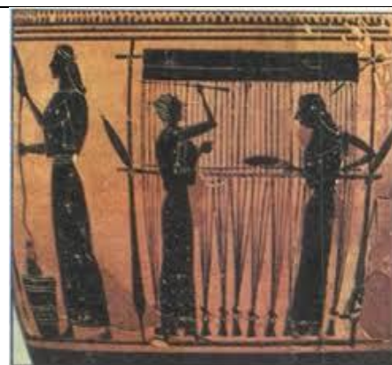
Γυναίκες στον αργαλειό

Γιάννης Λαμπράκης, Μόχλος, Α' τάξη (εργασία, κείμενο, έρευνα)