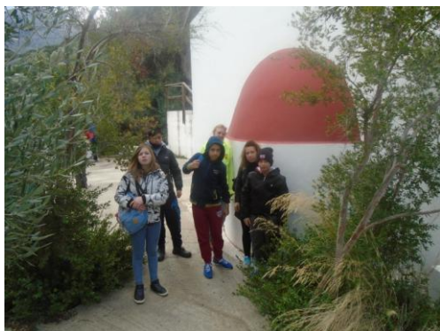
Στην Παναγία τη Μυρτιδιώτισσα