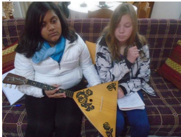
Τα κορίτσια περιεργάζονται τη μπαλαλάικα