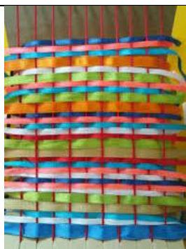
Ο τρόπος πλέξης των νημάτων στον αργαλειό