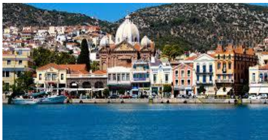
Η πόλη της Μυτιλήνης

»Η πρωτεύουσα του νησιού μας, η Μυτιλήνη, είναι μια από τις αρχαιότερες πόλεις της Ελλάδας, χτισμένη πάνω σε επτά λόφους στο ΝΑ τμήμα του νησιού. Στο νησί μας μπορείτε να έρθετε αεροπορικώς από την Αθήνα ή και από το Ηράκλειο, είτε με πλοίο από τον Πειραιά. Αν έρθετε από το λιμάνι, θα σας αρέσει πολύ η εικόνα της πόλης μας, κτισμένης αμφιθεατρικά, όπου δεσπόζει το κάστρο μας, καλά διατηρημένο που περιβάλλεται από πεύκα. Αξίζει να περπατήσετε στα γραφικά στενά δρομάκια και να επισκεφτείτε τις παλιές όμορφες εκκλησίες. Αξίζει επίσης να επισκεφτείτε το Μουσείο του λαϊκού ζωγράφου, Θεόφιλου Χατζημιχαήλ.