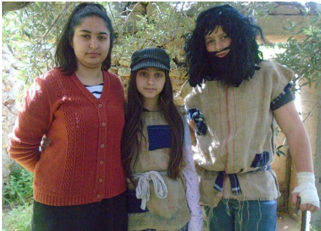
Η οικογένεια του Μητσάρα και δεξιά όλη η συμμορία του