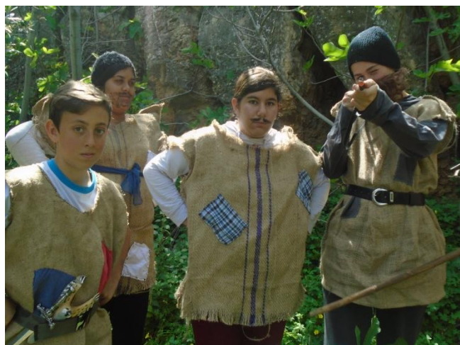
Η συμμορία του Παυλάρα