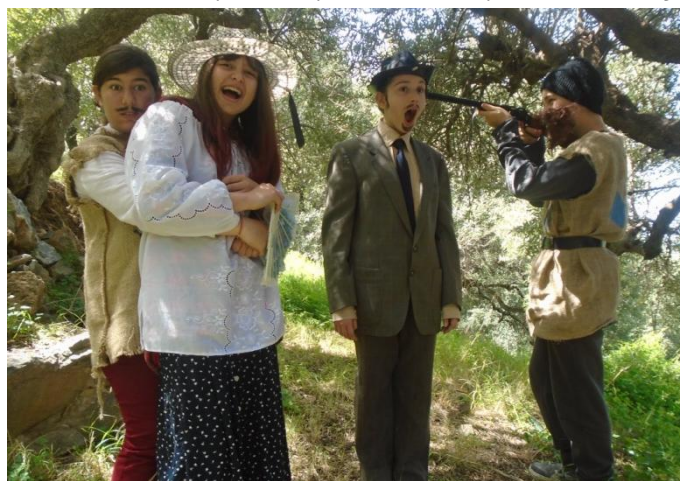
Επίθεση των ληστών στο δάσος